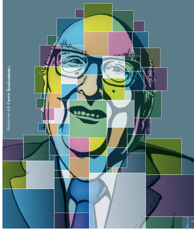
Illustrazione di E. Cavarra kreativemente.it